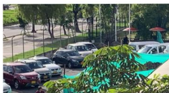
Foto Parqueadero zona 4.

¿TIENES ALGO PARA VENDER? Utiliza nuestra sección de Clasificados