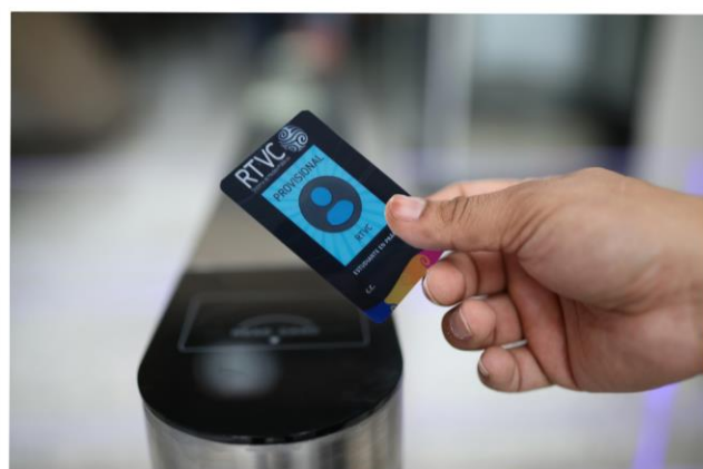
Foto - Uso del Carné

#SeSupoQue Si está enredado porque tiene algo para vender o arrendar y no sabe dónde ofrecerlo, no se preocupe, porque la Intranet tiene un espacio dedicado para que usted pueda publicar cualquier producto o servicio. Acceder a este servicio es muy fácil, tan solo debe ingresar a la opción de Clasificados de Intranet y diligenciar los datos solicitados.